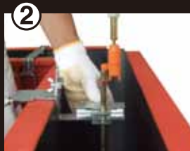
② アンカーボルトをアンカーセット金具に 固定する(ねじを締める)