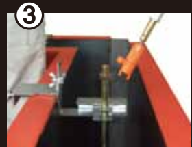
③ アンカーアイをアンカーボルトから外す