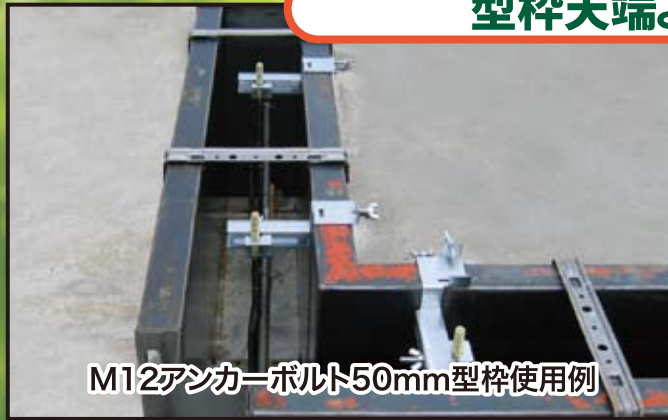
M12アンカーボルト50mm型枠使用例