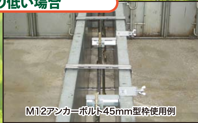
M12アンカーボルト45mm型枠使用例