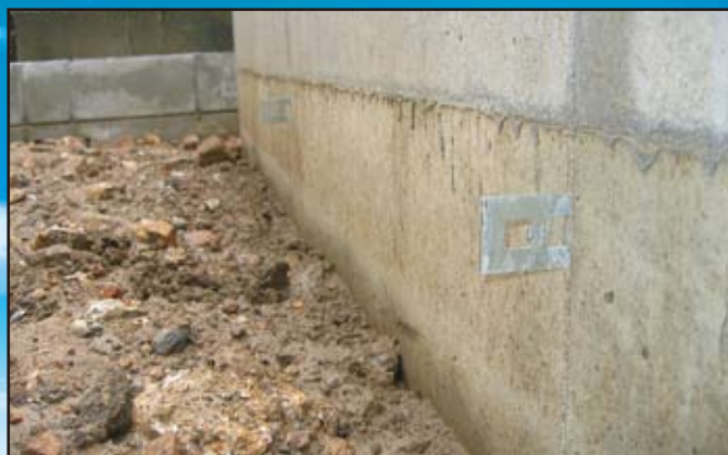
外周型枠脱型後の残ったSP止め金具は手で簡単に折り切ることができます。