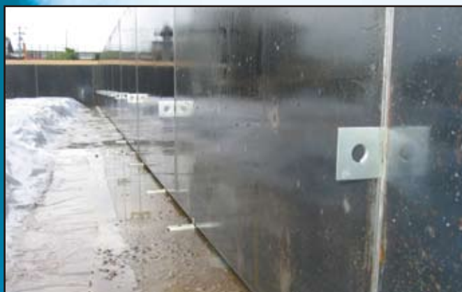
設置後、外周型枠の通りを振止めサポート等で調整します。 ※ベースコンクリート打設後、再度型枠の通りの確認をしてください。