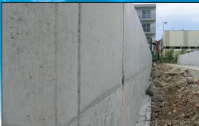
切断面は特殊メッキ鋼板(ZAM)の使用により、サビができません。 ※折り切ったSP止め金具は現場に残さず持ち帰ってください。