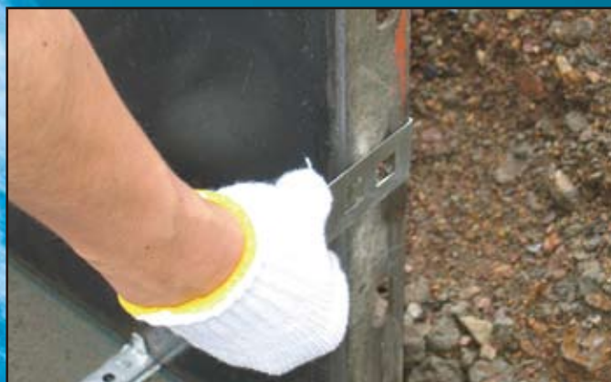
外周型枠のジョイント穴にSP止め金具(45巾・50巾向き)を取り付け、型枠を連結していきます。